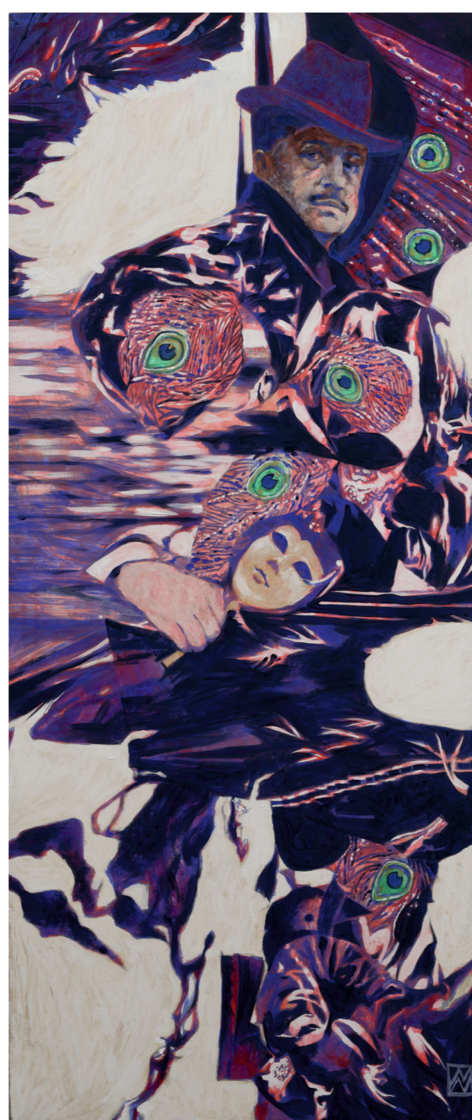
М. В. Нурулин. «Явление Дягилева», 2014, х., акрил, 120x170.