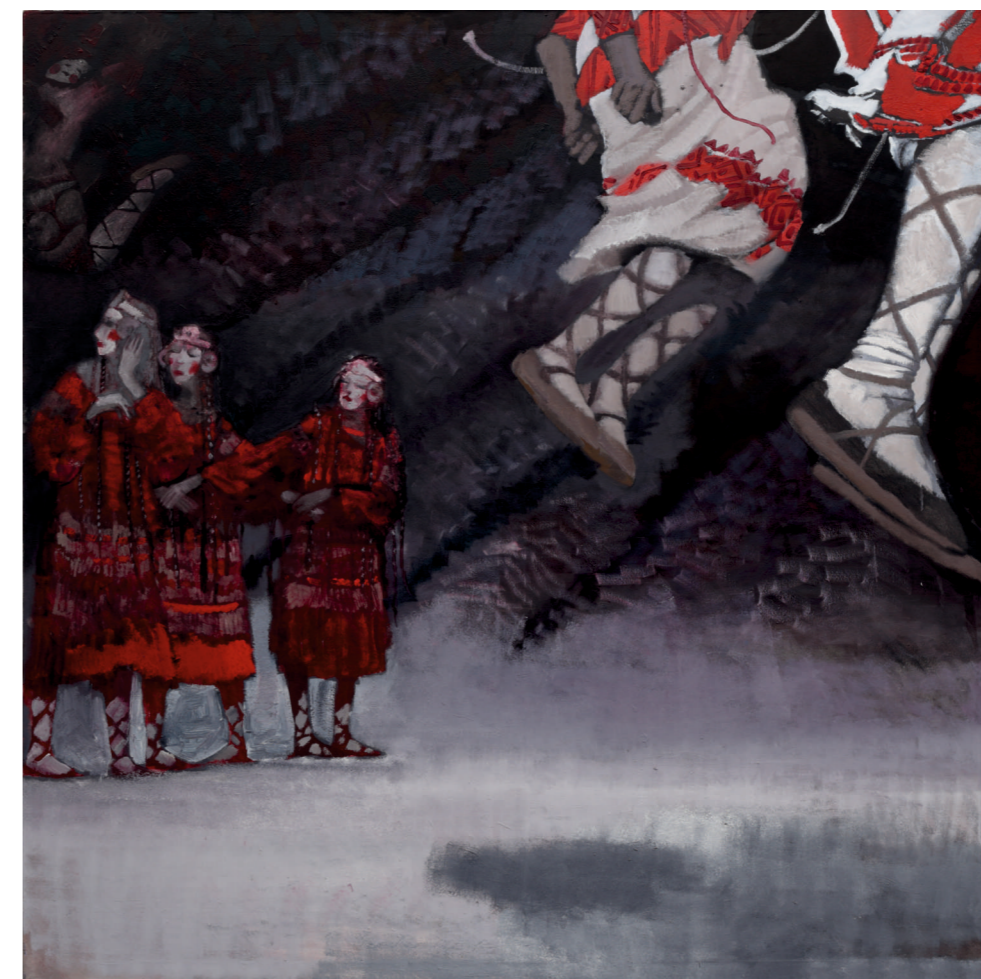
Т. Т. Нечехина. ««Весна Священная» Стравинского», 2014, х., м., 190x180..

Работы М.Нурулина тяготеют к стилистике модерна начала XX века, они почти монохромны, декоративны, в них присутствует характерный для модерна растительный орнамент, уплощенное пространство, сочетание реализма и условности изображения. Последнему путешествию Сергея Павловича Дягилева посвящена картина Нурулина «Сан Микеле».