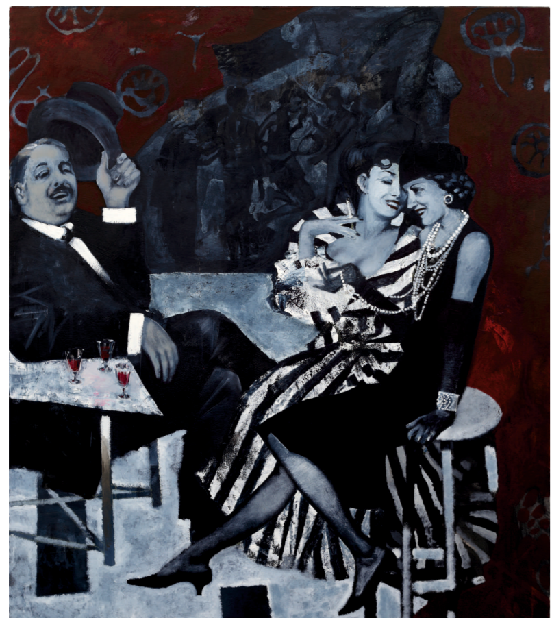
Т. Т. Нечехина. «Вино для Миси и Коко», 2014, х., м., 180x160.

В живописном цикле («Большие гастроли», «Триумфатор», «Цветы для Анны Павловой», «Цветы для Вацлава Нижинского», «Весна Священная», «Вино для Миси и Коко», «Дожди Венеции», «Явление Дягилева») художники воссоздали атмосферу начала XX века. Образы, созданные ими, имеют почти безграничную глубину и